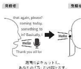
Magic Focus Voice 必要な音だけクリアに取り出す

声の特性を熟知し、開発された、NTTの特許技術「Magic Focus Voice」※1,2。音が2つのマイクに到達する時間差を利用して音響空間を認識し、話者を特定する「ビームフォーミング」、雑音を除去して音声だけを抽出する「スペクトルフィルター」の2つの技術をハイブリッド処理。周囲の音をカットし、あなたの「声」だけ届けます。